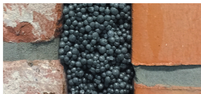
Isopearls is fabrikant en installateur van spouwmuurisolatie met geëxpandeerde polystyreenkorrels (EPS).